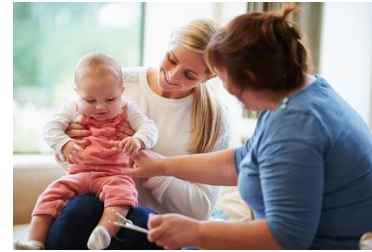
- professionelle Begleitung und Beratung

„Wenn die familiäre Atmosphäre - so dicht geworden ist,