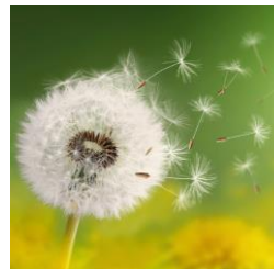
- Förderung der Erziehungs- und Lebensführungskompetenz