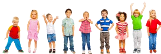
- Stärkung der Persönlichkeit junger Menschen