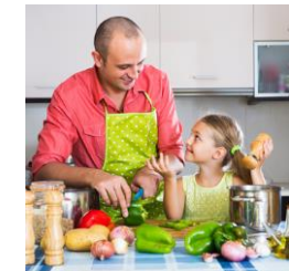
- lebenspraktische Unterstützung