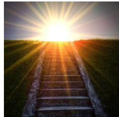
- Förderung emotionaler und sozialer Kompetenzen