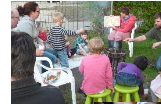
- Hilfe zur Selbsthilfe